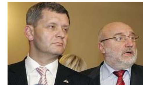
Finanzminister Slakteris und Premier Godmanis

Auf ihrer ausserordentlichen Sitzung am vergangenen Sonntag beschloss die lettische Regierung die Mehrheit der Parex Bank Aktien wegen Liquiditätsproblemen zu übernehmen. Mit demselben Beschluss übergab die Regierung 51% der Aktien an die Lettische Hypothekenbank (Latvijas Hipotēku banka), die die Bank verwalten wird. Es ist heute noch nicht endgültig klar, was die Übernahme der