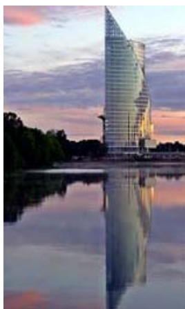
Das neue Hauptgebäude der Hansabank Lettland

Die aktive Kreditvergabe der skandinavischen Kommerzbanken in der baltischen Region und die fallenden Immobilienpreise haben ihre "Verwundbarkeit" und ihr Risiko erheblich erhöht, warnte die Schwedische Nationalbank (Riksbank). "Obwohl es den schwedischen Banken bisher gelungen ist, den Stürmen auf dem Finanzmarkt zu trotzen, ist ihre Verwundbarkeit zu anderen Risiken gestiegen", sagte Bankpräsident Stefan Ingves. "Die Kreditvergabe an Firmen und Privatpersonen in den baltischen Ländern bereitet immer noch Sorgen. Das Wachstum im Baltikum ist langsamer als erwartet," kommentierte Ingves. Die grösste Bank in der baltischen Region, die Swedbank, erwirtschaftet immerhin ein Drittel ihres Gewinnes in Estland, Lettland und Litauen. Die zweitgrösste baltische Bank, die SEB, generiert 20% ihres Gewinnes im Baltikum.